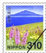
利尻礼文サロベツ国立公園 (利尻島)