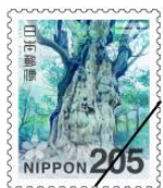
屋久島国立公園 (縄文杉)