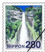
吉野熊野国立公園 (那智の滝)